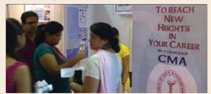
Career Fair - Times Education Expo on 7th & 8th December 2013 at Nehru Center, Worli.